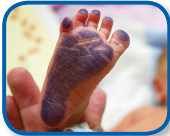
Los pies del bebé De 0 a 3 meses