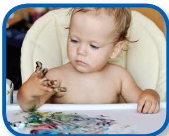
Pintar con los dedos De 9 a 12 meses