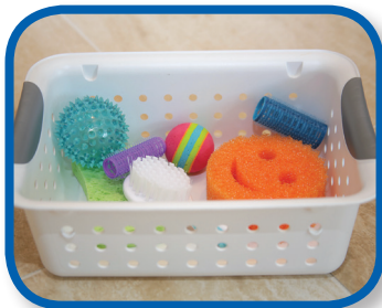
Cajas sensoriales De 3 a 9 meses