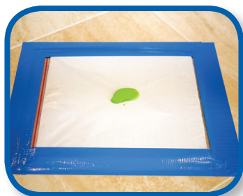
Paint in a Bag 3-9 months