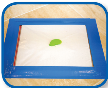
Pintura en una bolsa De 3 a 9 meses